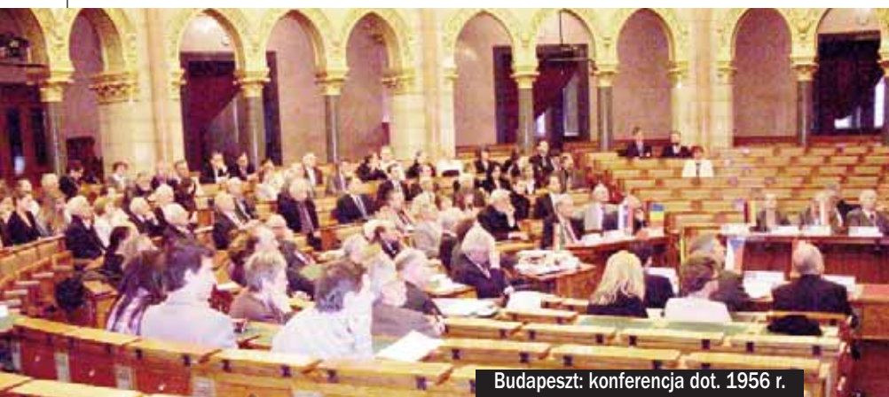
Budapeszt: konferencja dot. 1956 r.